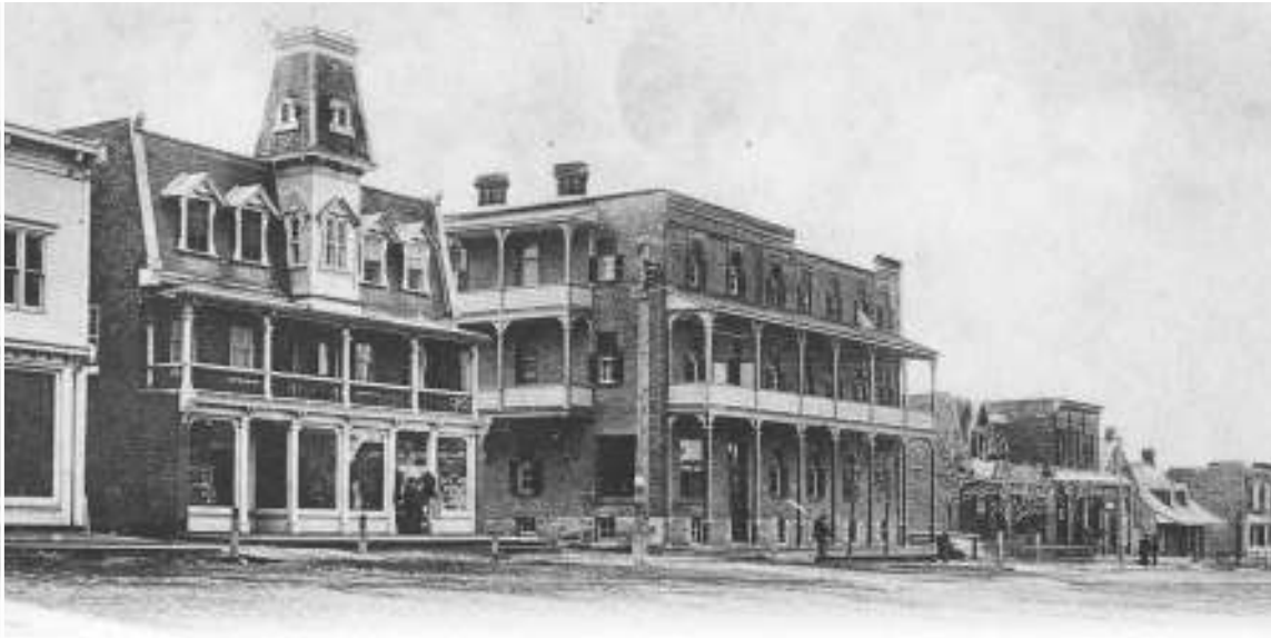
Léon Debien © Le Québec en images CCDMD

L'hôtel Rodrigue et le magasin Bauford situés sur la rue principale, qui en 1910, est de terre battue avec des trottoirs en bois.