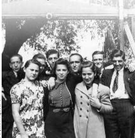
Groupe de jeunes gens devant l'entrée du pont de l'île du Seigneur en 1948.

Le Moyen Âge reste une période incontournable, même pour un jeune québécois d'aujourd'hui. Reste en effet toujours essentiel l'apport politique du Moyen Âge à la constitution de l'Occident : la naissance de l'Europe et des États qui la composent, le fossé creusé entre l'Occident et l'Islam, entre l'Occident latin et l'Occident de matrice byzantine. Mais il faut élargir la présentation du Moyen Âge à des thèmes qui débordent le politique : thèmes d'histoire des mentalités, tels que la naissance de l'antisémitisme, la perception de l'homosexualité, du suicide, du rôle de la femme ; thèmes d'histoire culturelle, tels que la naissance des langues européennes et l'émergence du catholicisme, création médiévale. Il faut surtout faire un effort pédagogique, lié à notre situation, pour détecter la persistance insoupçonnée du « substrat médiéval » dans notre vie et notre culture, ancienne et actuelle : de l'onomastique à la toponymie, de l'architecture néo-gothique au régime seigneurial, de la paroisse rurale au folklore.